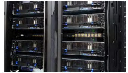
NVIDIA® Tesla® V100を8基搭載するNVIDIA DGX-1™は、データセンターに設置されている